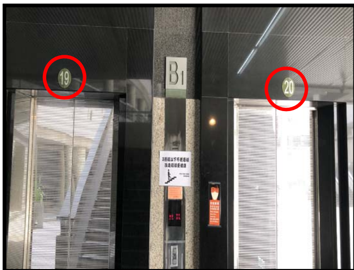
1. 第二醫學大樓搭乘19、20號電梯